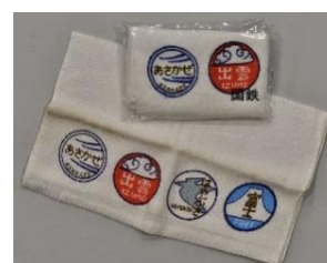
タオル(特急乗車記念)