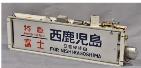
24系客車用行先表示器