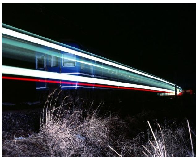
関ヶ原に挑む「さくら」 1977(昭和52)年12月 東海道本線 大垣～新垂井(当時)