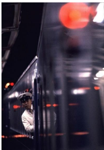
「あさかぜ」のカレチ(車掌長) 1979(昭和54)年7月 山陽本線 下関

1958(昭和33)年、東京～博多間の特急「あさかぜ」に20系客車が投入されて以降、青い車体の寝台特急列車、“ブルートレイン”は全国にその運転網を拡げ、1970年代に最盛期を迎えました。同時期に若年層のファンを中心に“ブルートレインブーム”が到来し、南氏は書籍や鉄道趣味誌で多数の作品を発表して、ブームの一翼を担いました。ブルートレインが姿を消した現在、南氏の作品群はかつての旅の様子を今に伝える貴重な記録となっています。本展では南氏の作品の展示と共に、当館が所蔵する関連資料を交えて、ブルートレインの“夢の旅路”を皆さまにご紹介します。