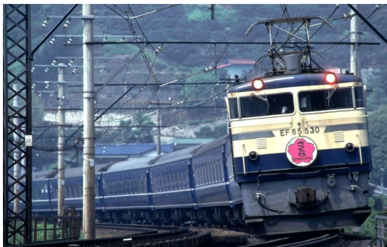
ピンク桜のヘッドマーク 1975(昭和50)年7月 東海道本線 真鶴～湯河原