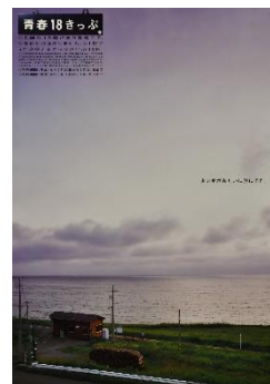
青春 18 きっぷ「五能線 巖木駅」