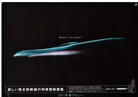
E5 系新幹線「What's my name?」