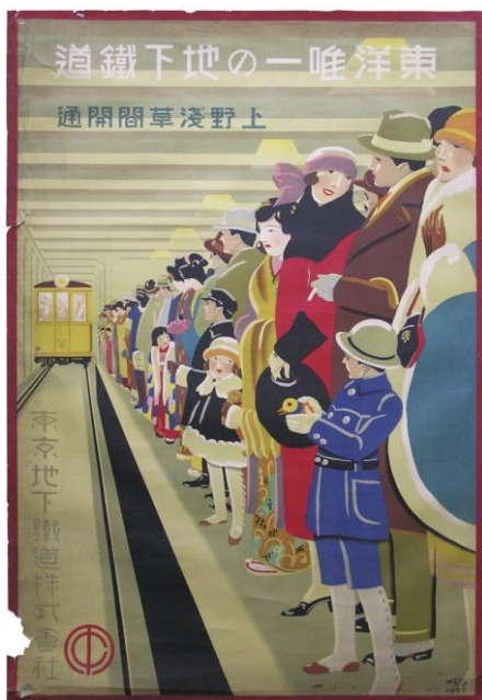
ポスター「東洋唯一の地下鉄道」(1927年) 一般社団法人 日本交通協会所蔵

多くの人々が行き交う駅は広告の宣伝効果の高い場所として、観光地へ誘うポスターや各種看板などが設置されています。ここでは駅をはじめ、さまざまな鉄道関係施設において見られる広告事例を紹介しします。