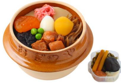
峠の釜めし