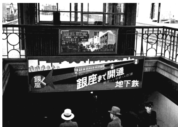
東京地下鉄道銀座線新橋駅の看板 (1934年)