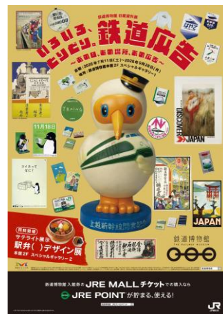
ポスター（イメージ）