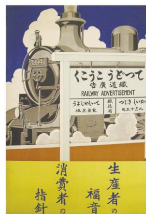
ポスター「てつどうこうこく」(1927年) 一般社団法人 日本交通協会所蔵