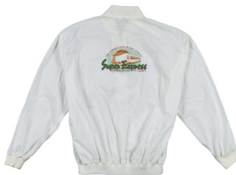
SUPER EXPRESS プロモーションイベント用 スタッフジャンパー（1989年）