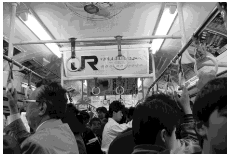
車内の中吊り広告（1987年）