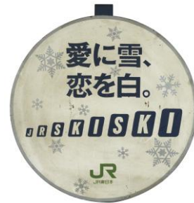
ヘッドマーク「JR SKI SKI」（1998年）