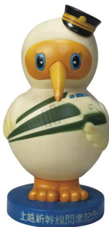
上越新幹線開業記念貯金箱 （1982年）

私たちの日々の暮らしの中にある、テレビCMや雑誌広告、販売促進グッズなど、鉄道をより身近に感じさせてくれる広告の数々を紹介します。特に鉄道会社のテレビCMは、起用された出演者や音楽とも相まって、懐かしさを感じていただけることでしょう。