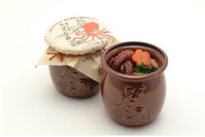
ひっぱりだこ飯