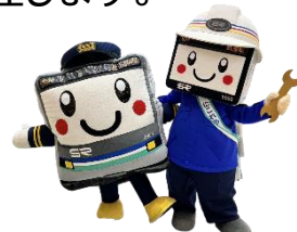
たまさぶろう&にこれる