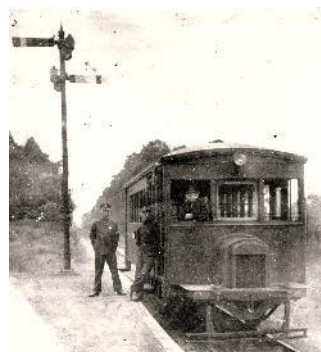
武州鉄道 浮谷駅に停車中の列車 昭和初期