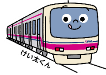
京王電鉄 公式キャラクター けい太くん