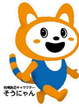
相模鉄道 キャラクター そうにゃん