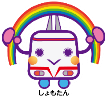
湘南モノレール キャラクター しよもたん