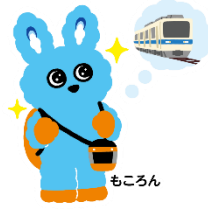
小田急電鉄 子育て応援 マスコットキャラクター もころん