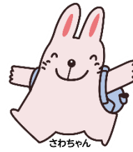
JR東海 ウォーキングイベント 「さわやかウォーキング」キャラクター さわちゃん