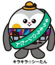
横浜シーサイドライン イメージキャラクター キラキラ☆シーたん