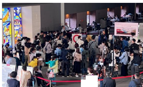
イベントイメージ