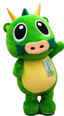
さいたま市PRキャラクター つなが竜ヌウ