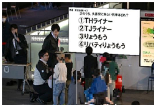
イベントイメージ