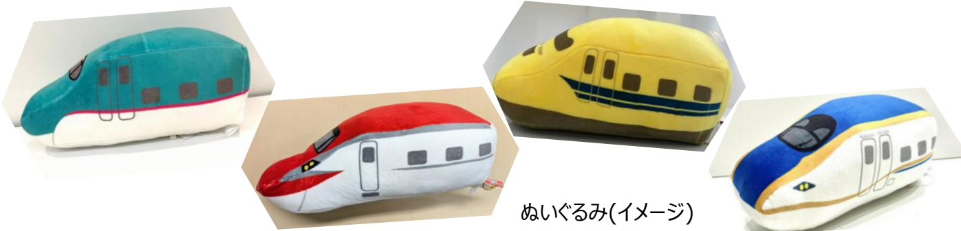
ぬいぐるみ(イメージ)