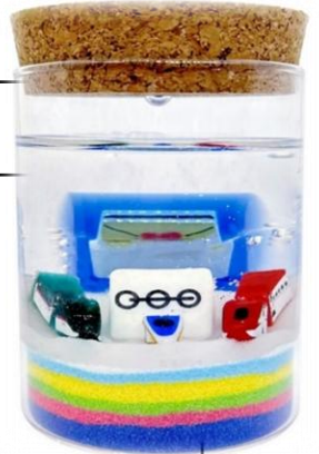
オリジナルキャンドル イメージ