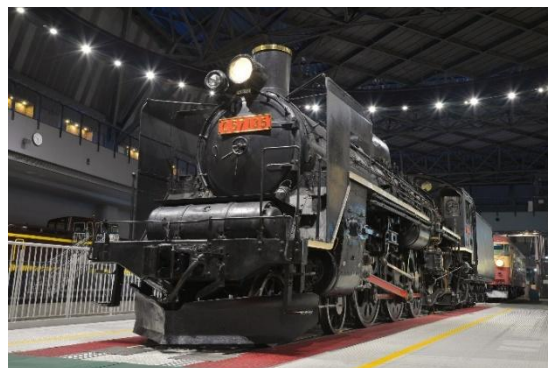
C57形蒸気機関車 (イメージ)