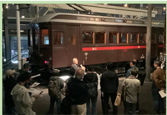
第11回実施時の様子