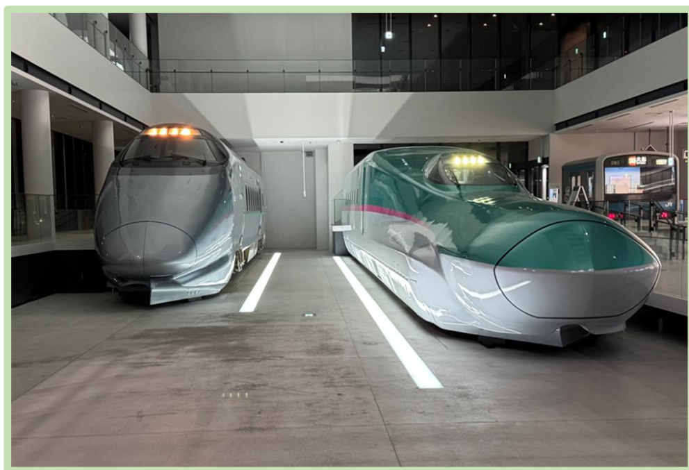
過去開催時の様子