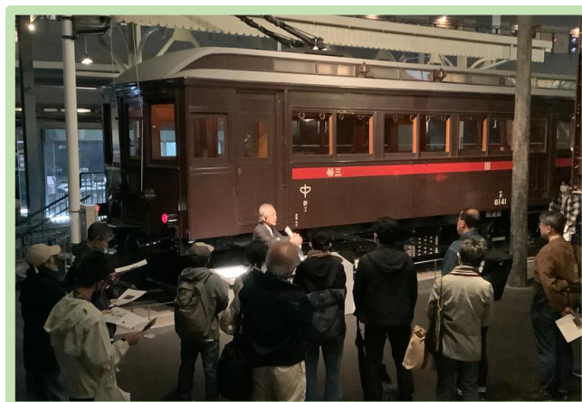
第11回（10月）実施時の様子