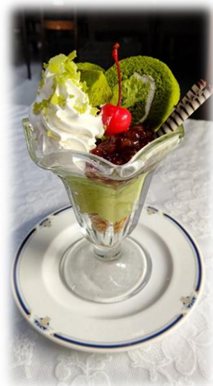
抹茶づくしの山手パフェ (イメージ)