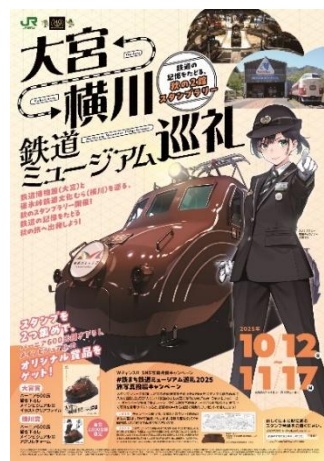
ポスター (イメージ)