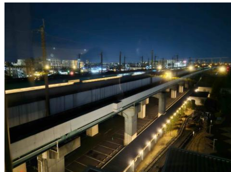
パノラマデッキからの風景 (イメージ)