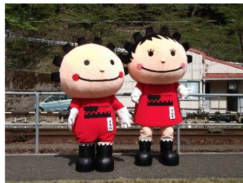
大井川鐵道井川線マスコットキャラクター 「アルル&プルル」(イメージ)