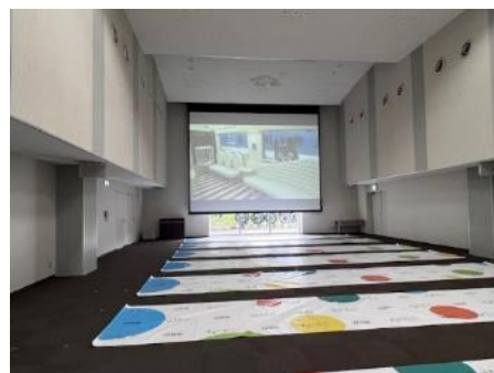
てっぱくホール (イメージ)