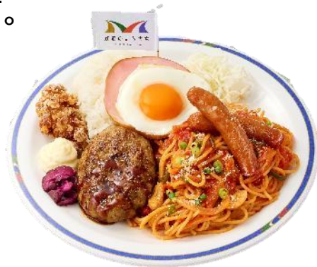
食堂車のわんぱくプレート (イメージ)