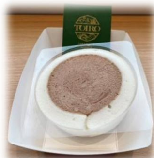
米粉ろおる (チョコレート) (イメージ)

他にも新メニューをご用意しておりますので、詳しくは当館ホームページのレストラン・ショップページをご覧ください！