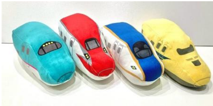
ぬいぐるみ（イメージ）