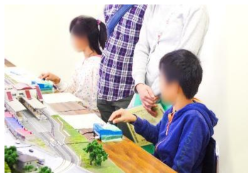
イベントの様子（イメージ）