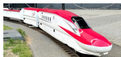
ミニはやぶさ・ミニこまち (イメージ)