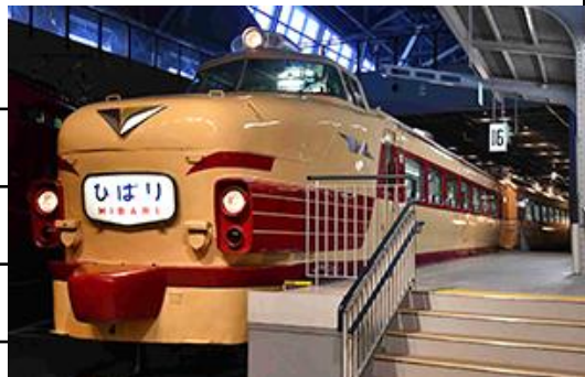
クハ481形電車(485系電車)

◆ガイドツアーはどなたでもご参加いただけますが、運転室の見学は当選された方のみご参加可能です。