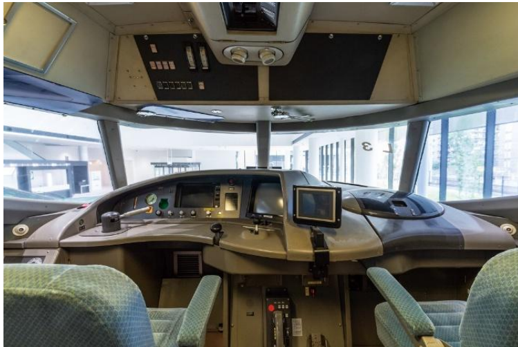
400系新幹線電車 運転室