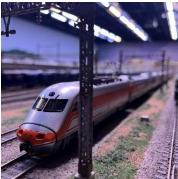
台湾鉄道公司「E1000型」 台湾で運行されている「自強号(じきょうごう)」の 主力車両として活躍しています。