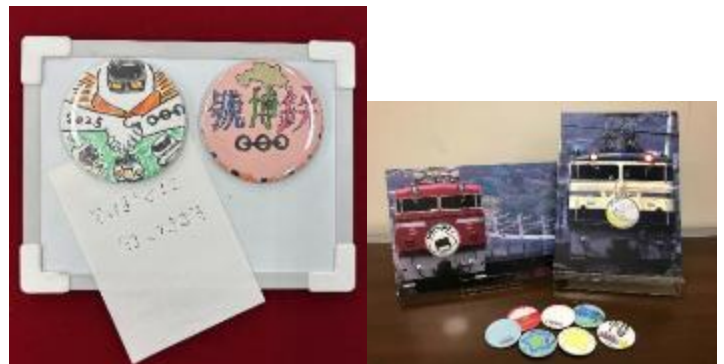
トレインマーク缶バッジ・マグネット (イメージ)