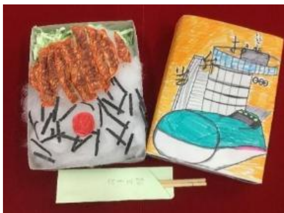
お弁当の中身も考えながら作りましょう！