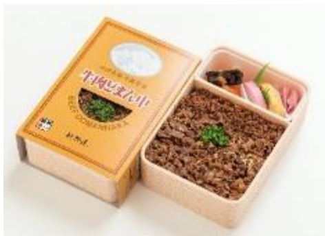
牛肉どまん中(新杵屋) 駅弁屋人気No.1! 秘伝のタレで味付けをした牛丼風のお弁当