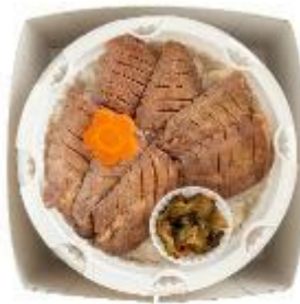
仙台名物牛たん弁当(こばやし) 加熱式弁当の中で 一番厚い牛たんを使用しています