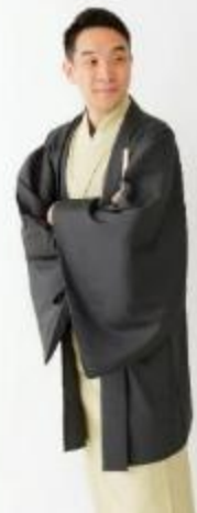
古今亭駒治