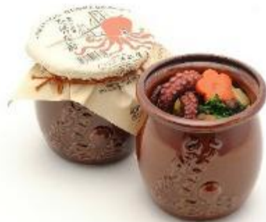
ひっぱりだこ飯(淡路屋) 陶器の器に 明石名物の真ダコの旨煮が入っています