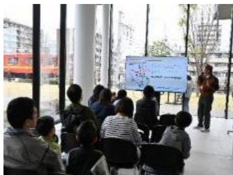
イベント実施の様子