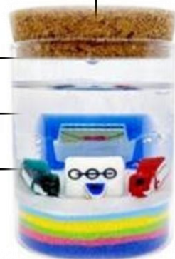
オリジナルキャンドル (イメージ)