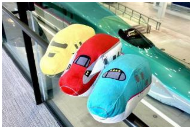
ぬいぐるみ(イメージ)