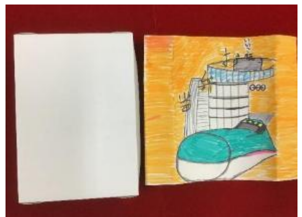
お弁当箱(紙)・かけがみは持ち帰ることができます！