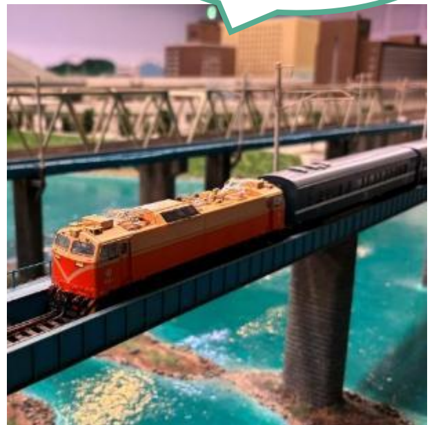
「R100型ディーゼル機関車 食堂車 客車」 台湾で運行されている優等列車「莒光号(きょくごう)」 として活躍していました。