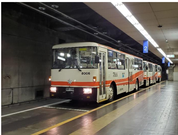
立山トンネルトロリーバス