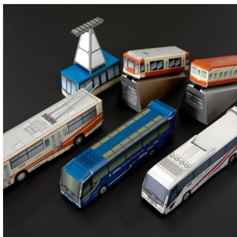
乗りものペーパークラフト