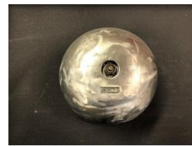
展示品一例：レトリバー