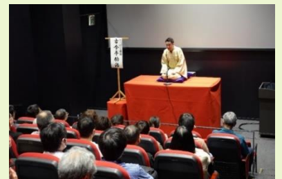
第1回(4/28)の「てっぱく落語」

「鉄道博物館でなぜ落語を？」と驚かれるかも知れませんが、当館では、車両や各展示、シミュレータなどの体験展示だけでなく、鉄道に関する様々な楽しみ方をご紹介していきたいと考えています。「鉄道落語」は、鉄道が好きな方や鉄道に親しみを感じられる方に必ず楽しんでいただけるものと思います。