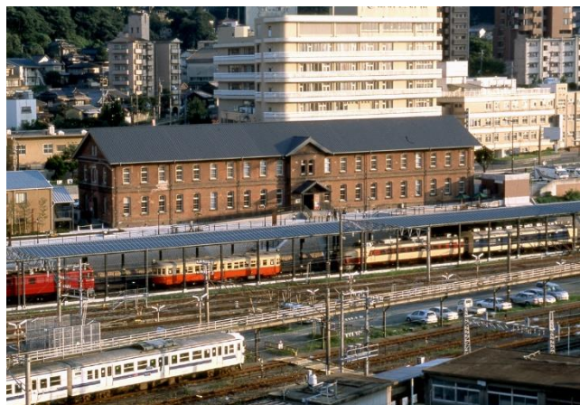
九州鉄道記念館(旧九州鉄道本社屋)と 42055気動車