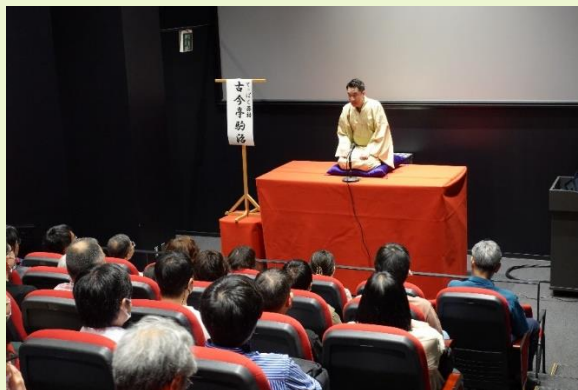
第1回(4/28)の「てっぱく落語」の様子

古今亭 駒治による『てっぱく落語』は今後継続開催し、 第3回は8月3日(土) です。(チケットは7月1日販売開始)