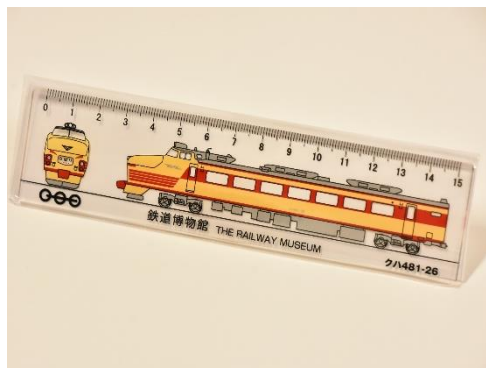
ノベルティグッズ (クハ481形電車定規)