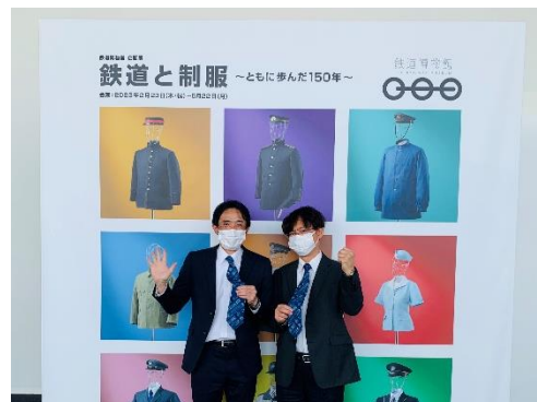
お揃いの服装(イメージ) 【例】ネクタイがお揃い