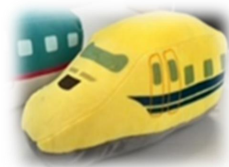
ドクターイエロー

ミュージアムショップ TRAINIARTでは、鉄道博物館限定グッズも販売しております。