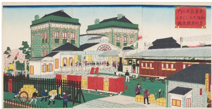
▲歌川広重(三代) 「東京名所之内 新橋ステーション蒸気車鉄道図」 1875(明治8)年