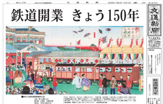
『交通新聞』2022年10月14日付