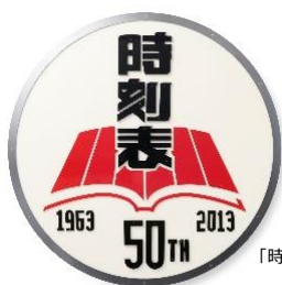
「時刻表50周年記念ヘッドマーク」