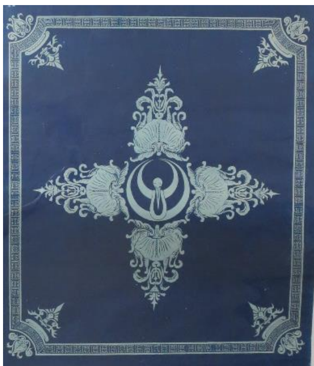
阪鶴鉄道の装飾図