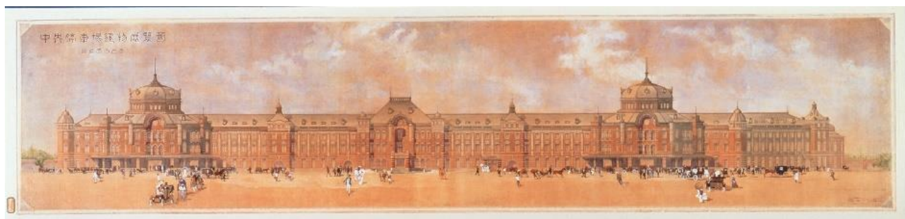
中央停車場建物展覧図 1910(明治43)年