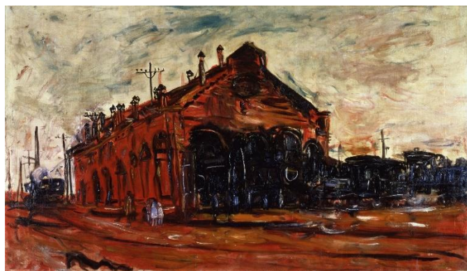
長谷川利行「赤い汽罐車庫」 1928(昭和3)年