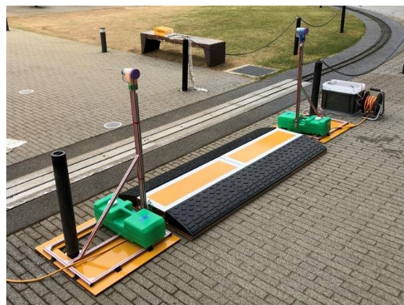
2022年3月設置の創作踏切