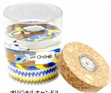
オリジナルキャンドル (イメージ)