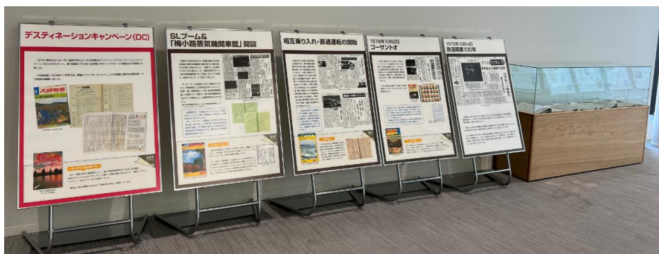
展示の様子(イメージ)