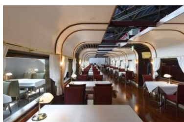
トレインレストラン日本食堂