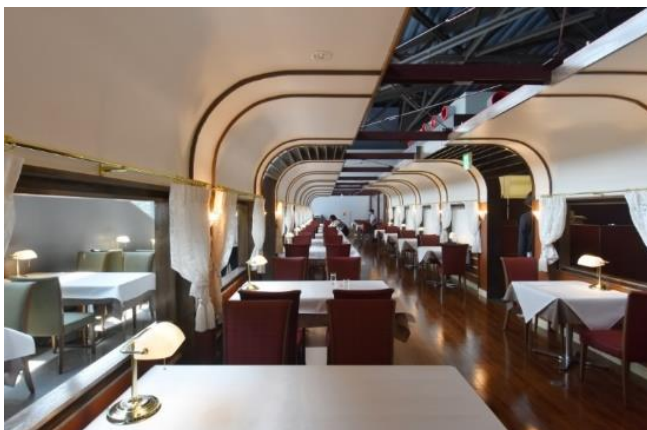
トレインレストラン日本食堂