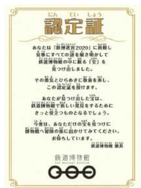
鉄博迷宮2020「9つの謎」シート(イメージ)