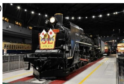
さようならSL ヘッドマーク(模造)