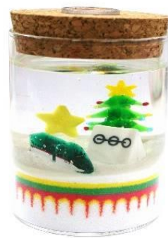
クリスマスオリジナルキャンドル (イメージ)

※12月29日（火）～2021年1月1日（金）は休館日です。 ※基本セットは、ガラス・カラー砂・鉄道博物館ロゴプレートのセットです。 ガラス（容器）の大きさや、オプションによって料金が変わります。