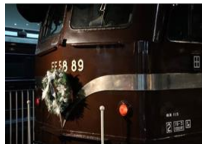
展示車両クリスマス装飾 (イメージ)