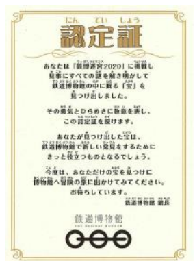
鉄博迷宮2020「9つの謎」シート(イメージ)