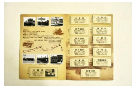
開業70周年記念入場券