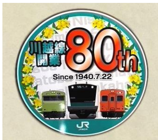
80周年記念ヘッドマーク