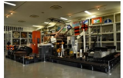
コレクションギャラリー