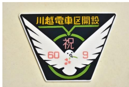
川越電車区開設記念プレート