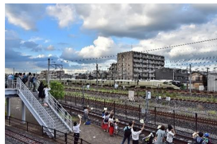
TRAIN SUITE 四季島 お手振り (8月頃実施の様子)