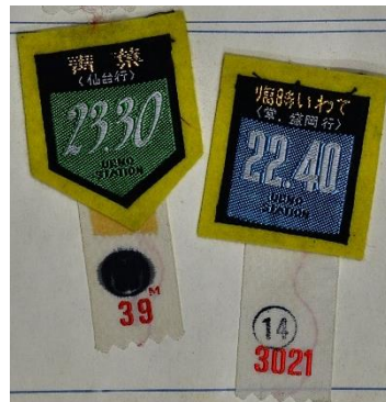
繁忙期の上野駅で使用された 列車案内用ワッペン 1964年