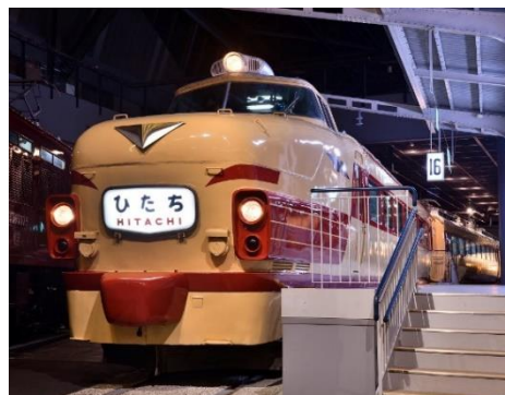
クハ481形「ひたち」(文字タイプマーク)