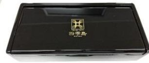
会津漆器のキーボックス (イメージ)

TRAIN SUITE 四季島の車内で実際に使用している工芸品や調度品等を展示します。TRAIN SUITE 四季島の世界感を味わえます。