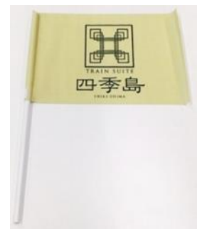
TRAIN SUITE 四季島 オリジナル旗(イメージ)

TRAIN SUITE 四季島をお見送りするときに使用するオリジナルの旗を作ります。当日16:43頃に通過するTRAIN SUITE 四季島のお見送りの際に使用します。