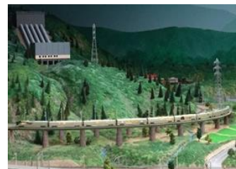
鉄道ジオラマを走行する TRAIN SUITE 四季島の HOゲージ(イメージ)

※これに伴い、15:10から実施する通常の「解説プログラム」は中止します。 ※14:00の「解説プログラム」終了後、準備のため14:30頃から鉄道ジオラマを締め切ります。