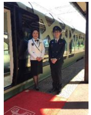
赤じゅうたんでの記念撮影 (イメージ)

TRAIN SUITE 四季島の5号車でお客さまをお出迎えする際に実際に使用している「赤じゅうたん」の上で、運転士、車掌、トレインクルーと一緒に記念撮影ができます。子ども用駅長制服もご用意しています。