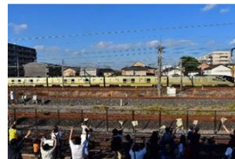
TRAIN SUITE 四季島にみんなで手を振ろう(イメージ)

※「てっぱく学校2019」の授業です。ご希望のお客さまに出席スタンプを押します。