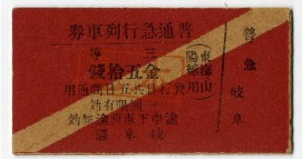
3等級制時代の普通急行乗車券 (明治45年)