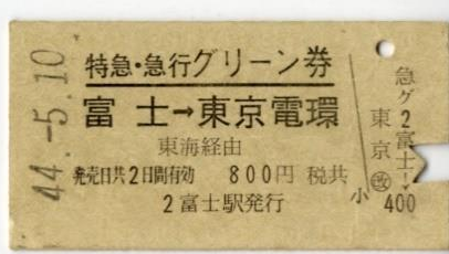
特急・急行グリーン券 (昭和44年)