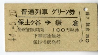
普通列車グリーン券 (昭和44年)