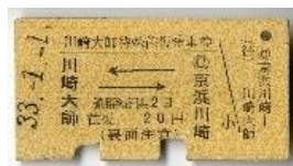
⑥川崎大師特殊往復乗車券 1958年