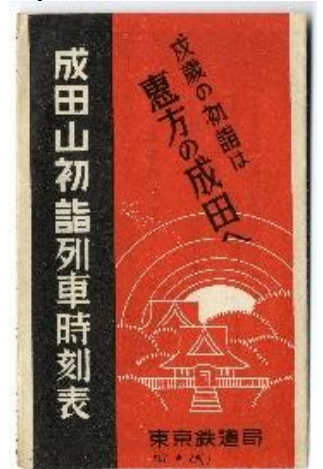
③成田山初詣列車時刻表 1934年