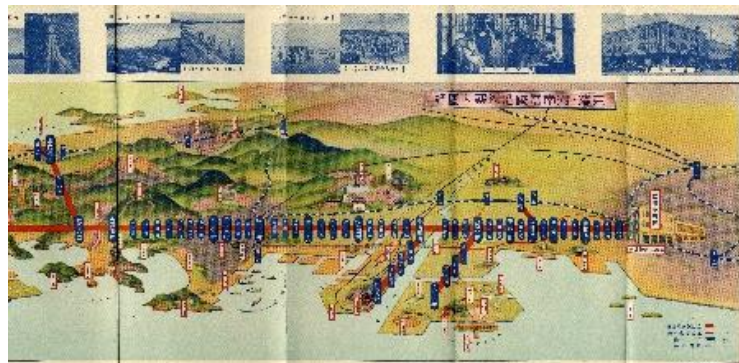
⑦京浜湘南沿線案内(部分)1934年