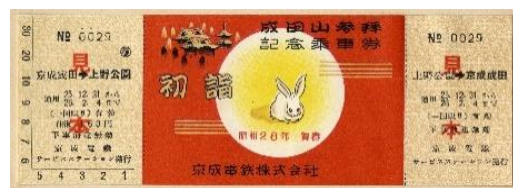
⑤成田山参拝記念乗車券 1950年