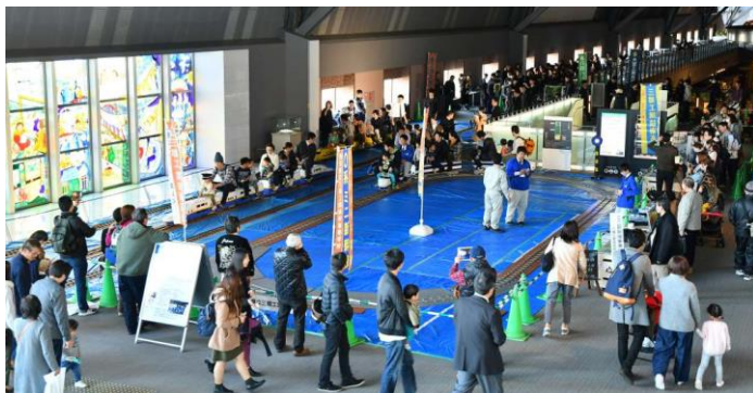
昨年の鉄道展の様子