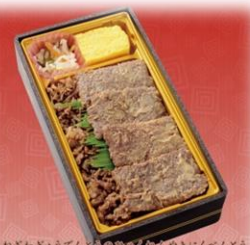
よねざわぎゅうてんとぎゅうぎゅうめいめいぎゅうべんどう 米沢牛 伝統の百年焼肉弁当

創業100年以上を誇る米沢の焼肉。厳選された肉の風味。 新鮮な米沢牛の焼肉の配合・製法で、米沢牛を堪能できる焼き上げました。