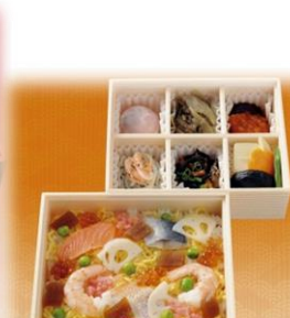
しゅうぎゅうめいめいぎゅうごはん 湘南の玉手箱

大船軒創業120周年を記念して、海鮮ちらし寿司と、 湘南産の新鮮な魚介を贅沢におかずを、一段特等仕上げてました。 伝統と人気の味をお楽しみください。