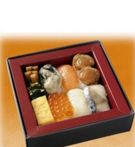
あもりでさくらひのしぐさひやくばーせんぞすしべんどう 青森と三陸の 食材100%寿司弁当