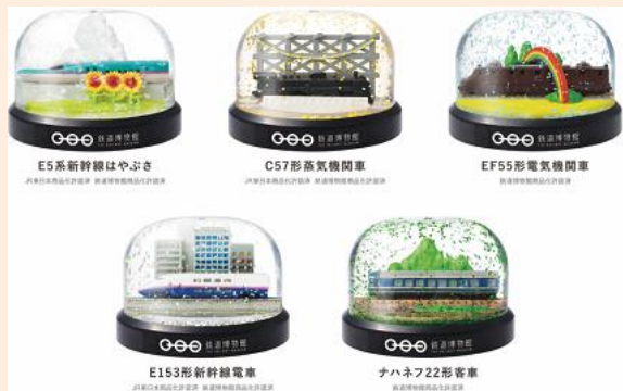
オリジナルカプセルスノードーム 500円(税込)

鉄道博物館での体験や学びをカタチとしてお持ち帰り頂ける商品を取り揃えております。