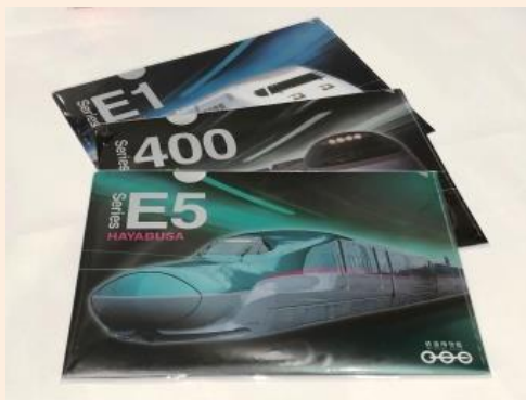
メタリックファイル 各種 各 357円(税込)