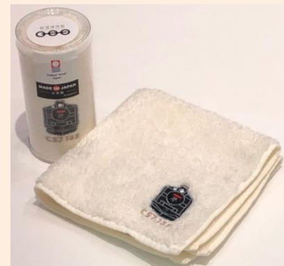
タオルハンカチ C57 135 764円(税込)