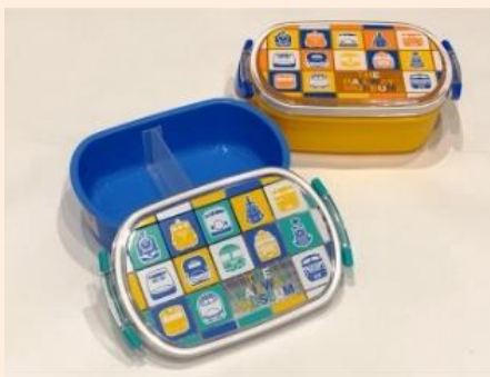
てっぱく ランチボックス 各 1,100円(税込)