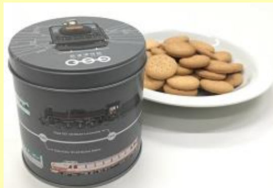
缶入りビスケット 950円 (税込)