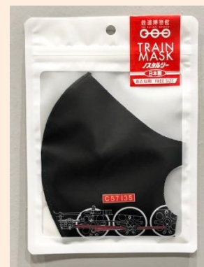
オリジナルC57135 TRAINマスク 各 550円(税込)