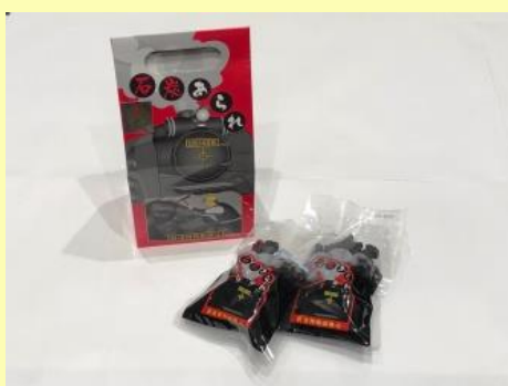
石炭あられ 648円 (税込)