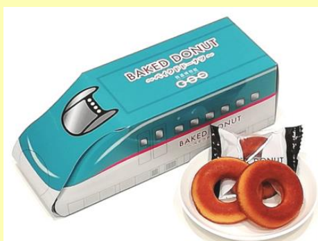
E5系バイクドーナツ 1,000円 (税込)