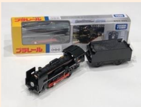
プラレール C57 135 2,953円(税込)