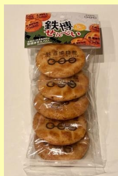
鉄博せんべい 540円 (税込)