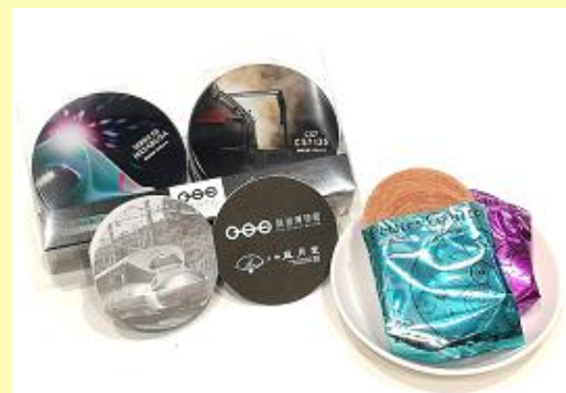
プチゴーフル2缶セット 1,150円 (税込)