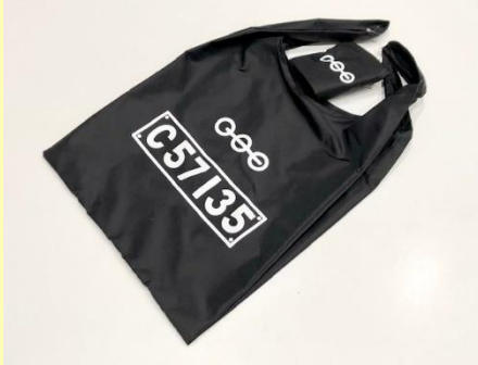
オリジナルC57135 BAGGU 2,200円 (税込)

※各商品は、JR北海道、JR東日本、JR東海、JR西日本の商品化許諾済です。 ※数量に限りがある商品もございますので、品切れの節はご容赦ください。 ※通信販売はしていません。 ※混雑時には入店制限をさせていただいております。時間帯によってご来店いただけない場合がございます。 予めご了承ください。