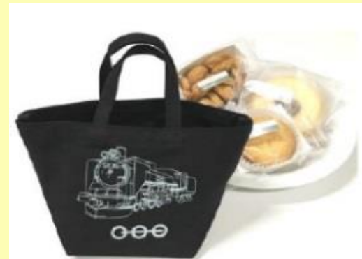
紀ノ国屋ミニスイーツバッグ 1,400円 (税込)