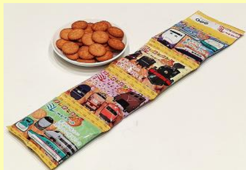
ミレービスケット 450円 (税込)

鉄道博物館での体験や学びをカタチとしてお持ち帰り頂ける商品を取り揃えております。