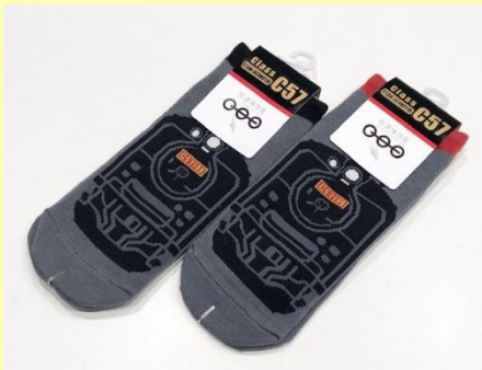
オリジナルのびのびソックス 各色 660円 (税込)