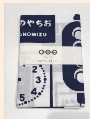
オリジナル手ぬぐい 看板づくし 1,265円(税込)

※各商品は、JR北海道、JR東日本、JR東海、JR西日本の商品化許諾済です。 ※数量に限りがある商品もございますので、品切れの節はご容赦ください。 ※通信販売はしていません。 ※混雑時には入店制限をさせていただいております。時間帯によってご入店いただけない場合がございます。 予めご了承ください。