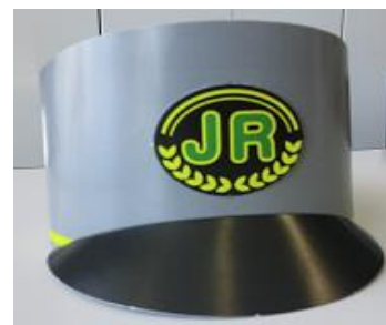
【サンバイザー完成イメージ】