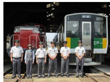
【内房線運転士と車掌】