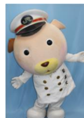
JR東日本千葉支社 マスコットキャラクター 駅長犬