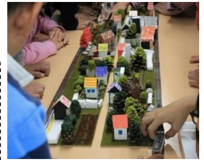
【街づくり完成イメージ】