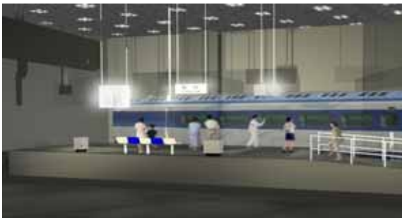
【開業当時の東京駅新幹線ホーム一部情景再現イメージ図】