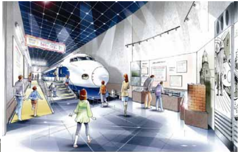
【0系新幹線展示イメージ図】