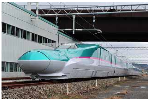
東北新幹線E5系「はやぶさ」