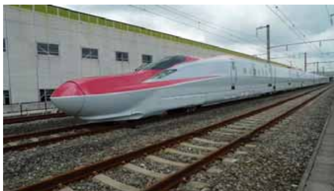
E6系新幹線車両(量産先行車)