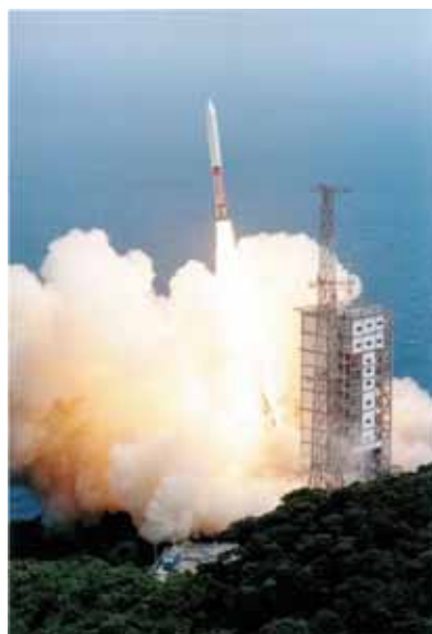
M-Vロケットによる打ち上げ 鹿児島県内之浦町(現:肝付町)