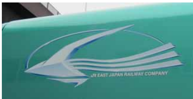
E5系「はやぶさ」シンボルマーク