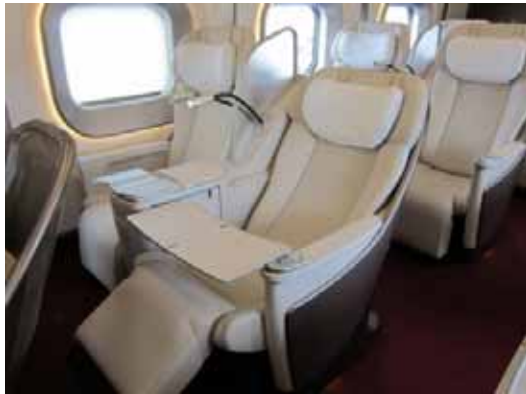
グランクラス座席

グランクラス座席は、3月中旬から展示する予定です。また、着席体験は、時間限定イベントとなります。