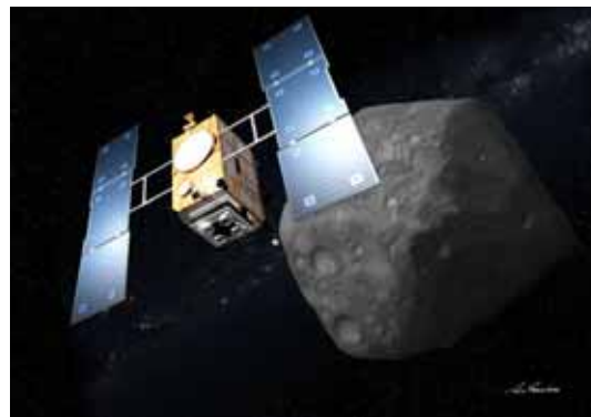
小惑星探査機「はやぶさ2」(イメージ)