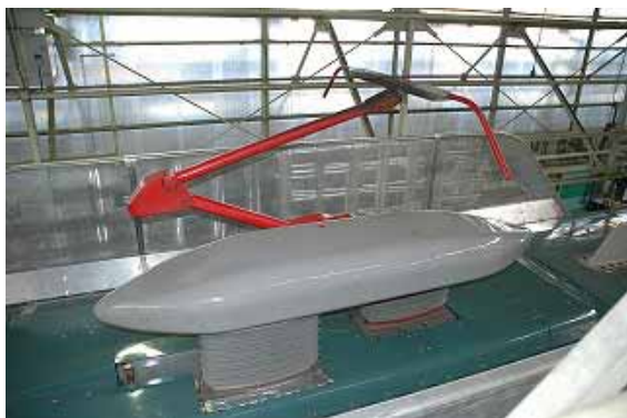
試験車ファステック360Sパンタグラフ

東北新幹線E5系「はやぶさ」模型、試験車ファステック360Sパンタグラフ(E5系のものとはほぼ同じ)、小惑星探査機「はやぶさ」模型、小惑星イトカワ模型、各技術の紹介パネルなど