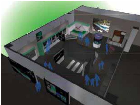
会場レイアウトイメージ