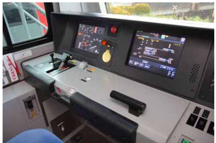
実際の E 2 3 3 系運転台

【リリースに関するお問い合わせ先】 鉄道博物館 営業部 (広報担当:松河、大野) TEL 048-651-0088 FAX 048-651-0570