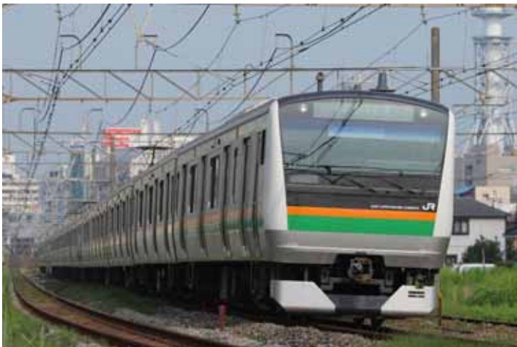
E 2 3 3 系電車