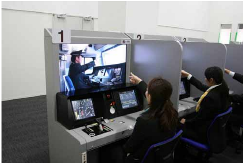
運転士体験教室イメージ

主幹制御器(マスターコントローラ) 手前に引くと加速し 奥に倒すとブレーキが効く。