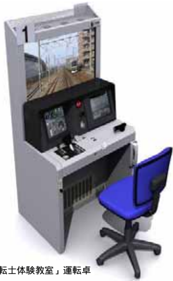
「運転士体験教室」運転卓