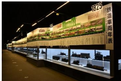
学芸員による鉄道車両年表ガイドツアー