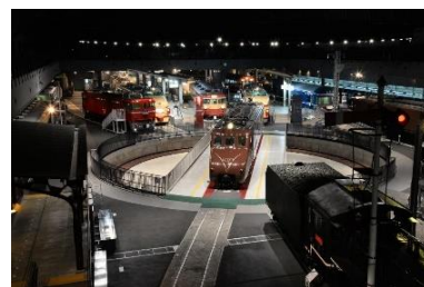
車両ステーション

※数字の「12」だけでなく、「1」と「2」が連続している数列も対象です。（例）1292 など