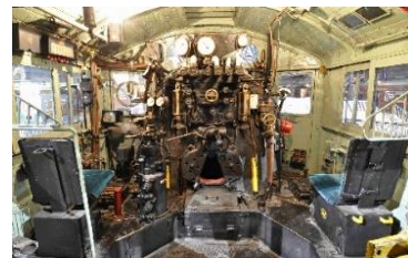
C57 形蒸気機関車 運転室

※15：50 頃から列に並んでお待ちいただけます。 ※見学時間は 1 人約 2 分間です。入替え制でご案内します。