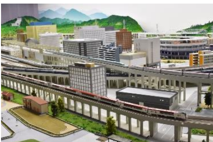
学芸員による鉄道ジオラマバックヤードツアー