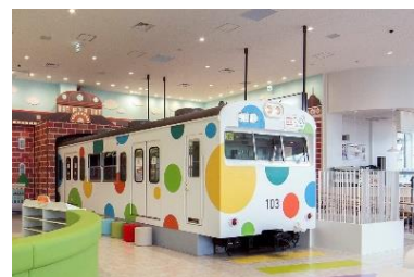
キッズプラザ 103 トレイン

※各日2回（①10：00～、②13：00～）本館1階車両ステーション クハ181形電車前でそれぞれの回の整理券（先着20名）を配布します。