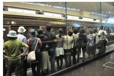
御料車庫見学ツアー （イメージ）

※各日、14：00～本館 1 F 車両ステーション 1 号御料車前で整理券（先着 20 名）を配布します。 ※御料車内には入れません。 ※開始 5 分前に本館 1 F 車両ステーション 1 号御料車前に集合してください。 ※手荷物をコインロッカー等に預けたうえでご参加ください。 ※写真撮影はご遠慮ください。