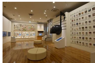
鉄道文化ギャラリー

本館2F「鉄道文化ギャラリー」の企画・設計から製作に携わった学芸員が、その経緯や完成までの苦労話、見過ごしてしまいそうな見どころなどを様々なエピソードを交えてご紹介します。