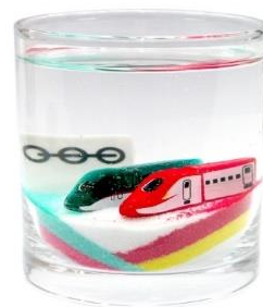
オリジナルキャンドル （イメージ）