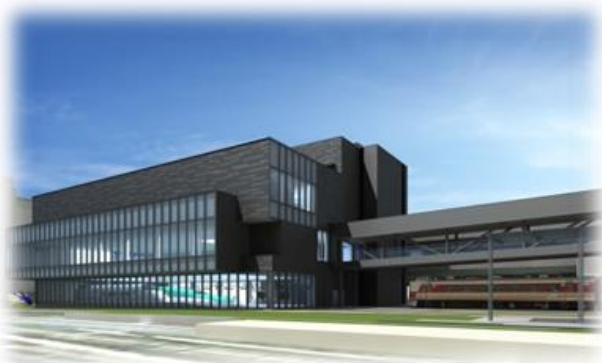
新館完成予想図（イメージ）