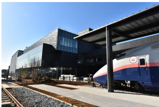
建設中の新館（2018年2月現在）