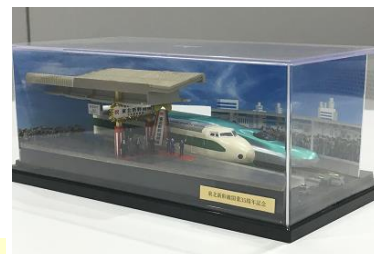
〈ジオラマディスプレイ〉 ※実物とはデザインが異なります

東北新幹線開業 35 周年を記念して JR 東日本と鉄道模型メーカー KATO がコラボレーション。模型の世界で新旧新幹線の並列を再現！