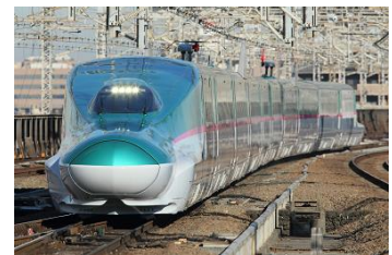
〈東北新幹線 E5系(イメージ)〉

大宮駅・小山駅・宇都宮駅・那須塩原駅・新白河駅・郡山駅・福島駅・白石蔵王駅・ 仙台駅・古川駅・くりこま高原駅・一ノ関駅・水沢江刺駅・北上駅・新花巻駅・盛岡駅