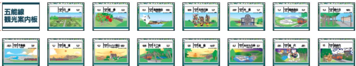
【五能線駅名標パネル】