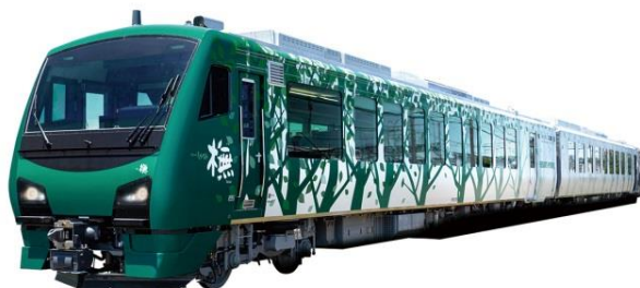
【リゾートしらかみ「撫」編成】