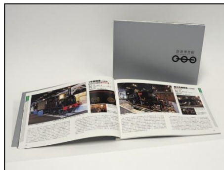
鉄道博物館ハンディ版公式図録