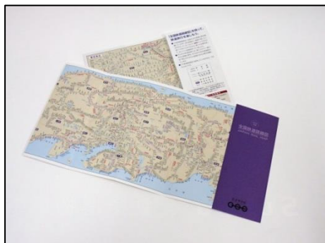
全国鉄道路線図(のりつぶしマップ)