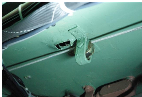
運転室内の機銃掃射痕 (スペースの都合上ご見学はできません)