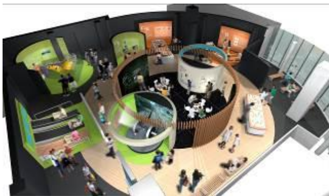
「科学」のステーション イメージ