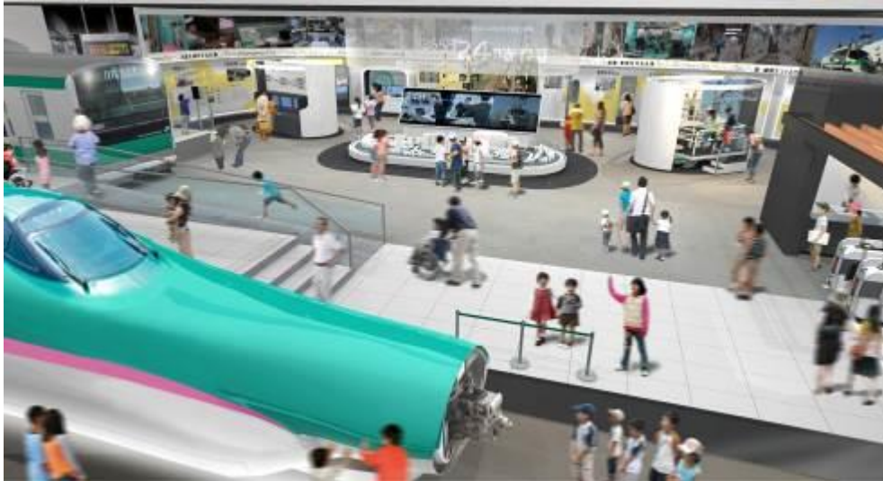
「仕事」のステーション イメージ