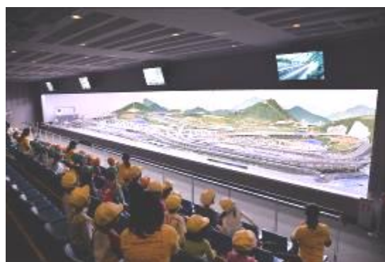
模型鉄道ジオラマ(現在)

開館以来初となる、全面リニューアルを行います。観客席との間のガラスの仕切りを撤去して臨場感を高めるなど、全面的に作り直します。