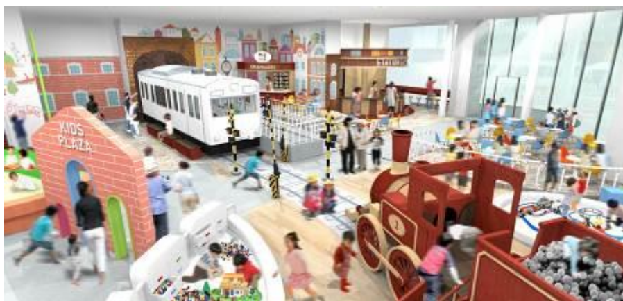
キッズ&カフェテリアスペース イメージ

現在の「ラーニングゾーン」1階を、鉄道をモチーフにした創造性豊かな遊びを展開するキッズ&カフェテリアスペースにリニューアルします。