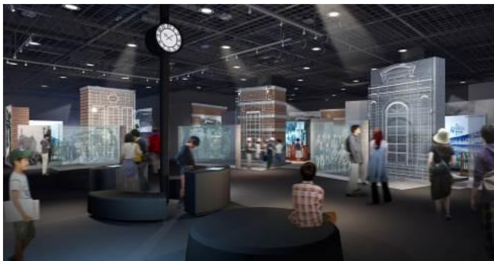
「歴史」のステーション イメージ