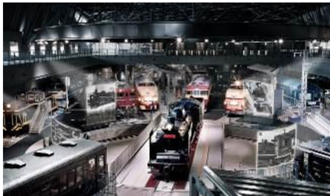
「車両」のステーション イメージ