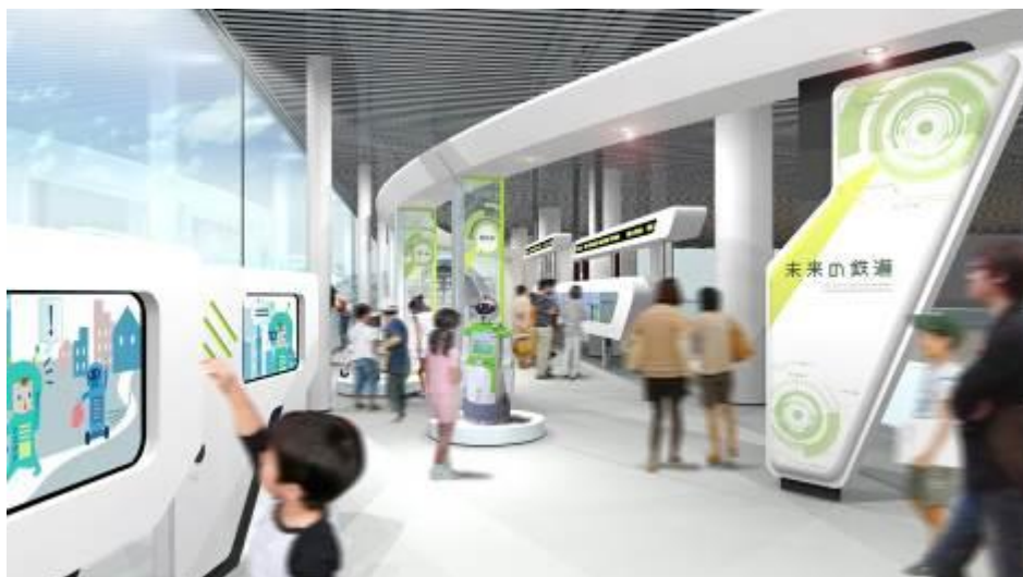
「未来」のステーション イメージ