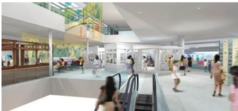
「旅」のステーション イメージ