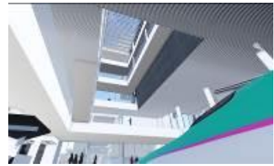
新館 吹き抜けイメージ