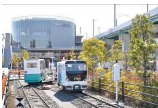
ミニ運転列車(現在)