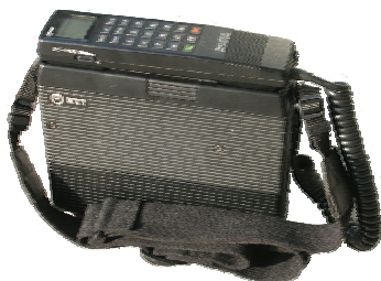
携帯電話機(ショルダーフォン)