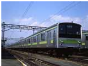
205系電車 1985(昭和60)年登場