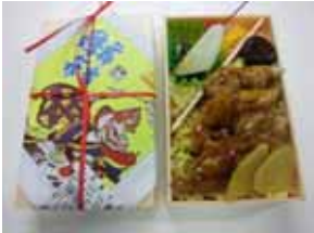
鶏舞弁当(一ノ関駅)

駅弁屋では、1960～70年代に一ノ関、米沢、郡山、小田原駅で販売した「駅弁」を期間限定で復刻販売します。また、レストラン日本食堂では、1970年代に食堂車で販売した「三陸フライ定食」にちなみ「フライ盛り合わせ」を期間限定で販売します。