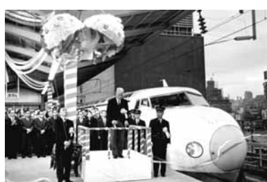
東海道新幹線開業