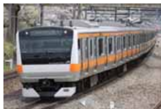
E233系電車 2006(平成18)年登場