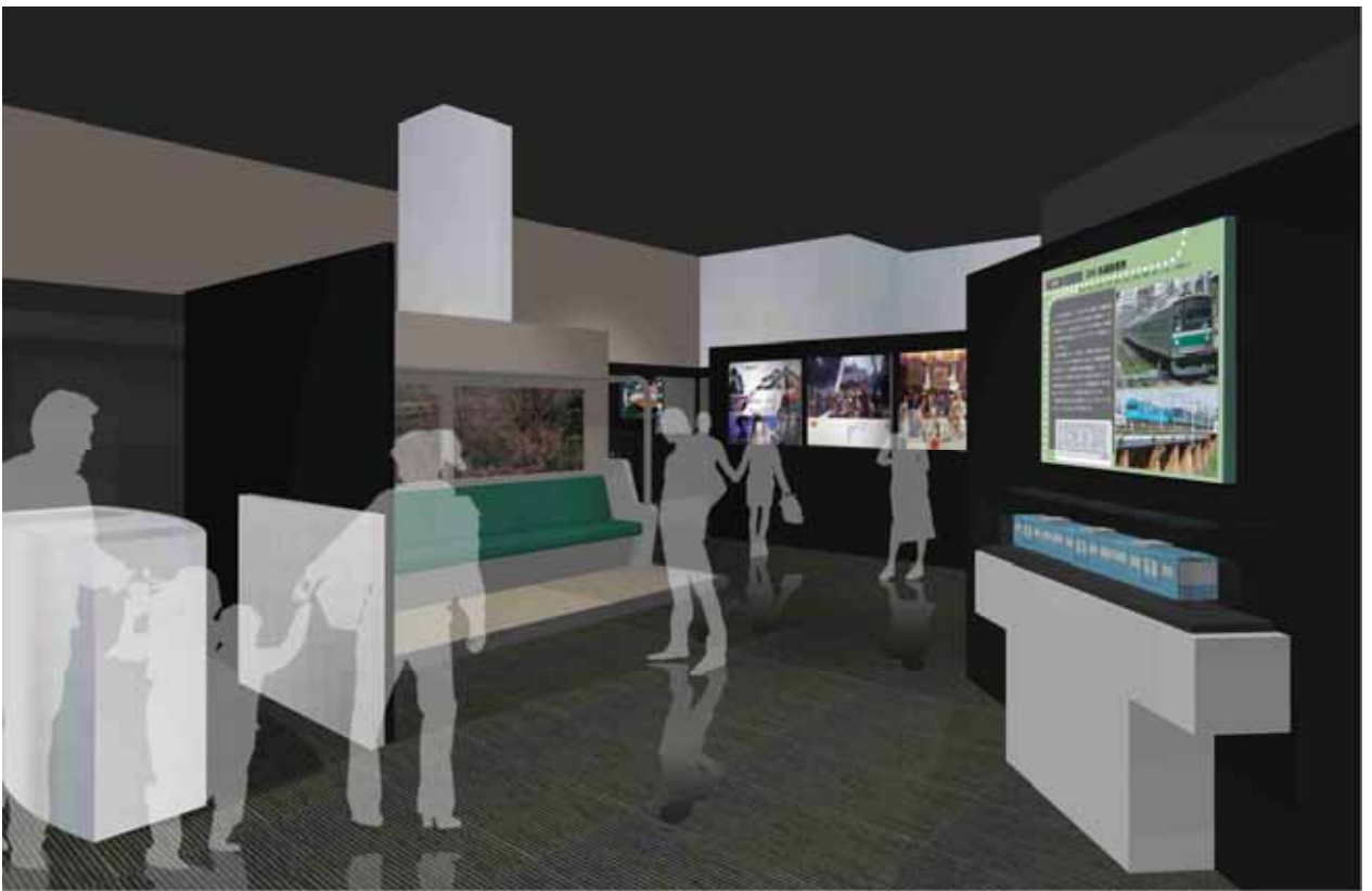
イメージパース 急成長と変革の時代