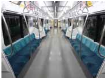
マナー向上を目指した通勤電車で座席の座り心地を体験できます(イメージ) 着座体験できます

JR東日本で研究開発しているマナー向上を目指した通勤電車で座席の座り心地を体験できます。また、会場の壁を最大限に生かしたシルエットのE5系新幹線「はやぶさ」の線画ボードを利用して、来館者に配布するカラー用紙に「10年後の鉄道の未来や日本の未来」をコメントしていただき、E5系新幹線「はやぶさ」の切り絵を完成させていきます。さらに、未来に送ることができる未来郵便も紹介します。