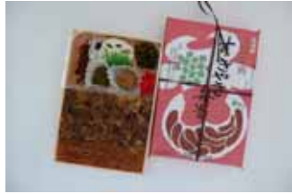
復刻版米沢牛肉すきやき弁当 (米沢駅)