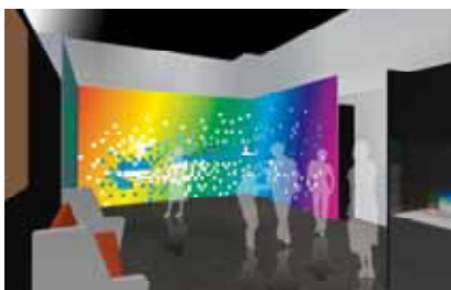
E5系新幹線「はやぶさ」の切り絵(イメージ)