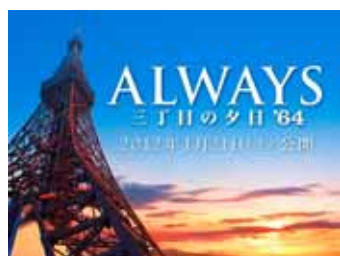
映画「ALWAYS 三丁目の夕日 64」 2012年1月21日(土)全国東宝系公開