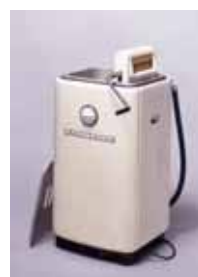
電気洗濯機(実物) 1954年 松下電器産業製 川崎市市民ミュージアム所蔵