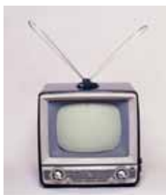
白黒テレビ(実物) 1950年代 早川電機工業製 川崎市市民ミュージアム所蔵

1960年代(昭和30年代半ば)の一般家庭のお茶の間を再現。このころ電化製品の「三種の神器」としてテレビ・冷蔵庫・洗濯機が生活必需品として普及し、豊かなくらしの幕開けとなりました。それらを展示します。