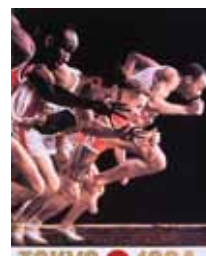
東京オリンピック開催(実物) 亀倉雄策デザイン