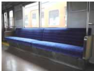
205系電車車内(イメージ) 着座体験ができます

国鉄が鉄道車両の低コスト、軽量化や省メンテナンス化、車内の快適性に取り組み製造した205系電車を紹介し、また、人々の価値観や生活様式が急激に変化した時代の姿を、ゲーム機器や電話機の移り変わりをご覧いただきながら紹介します。