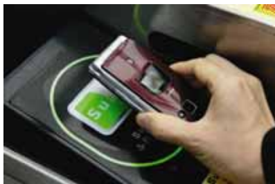
モバイルSuica(イメージ)

IT技術の普及により、個人で情報発信が出来る時代へと様変わりしています。鉄道では、きっぷからモバイルSuicaまでの変遷の紹介や多様化するお客さまニーズに応え「バリアフリー」や「ユニバーサルデザイン」など人にやさしい車両として登場したE233系電車のモックアップを展示します。