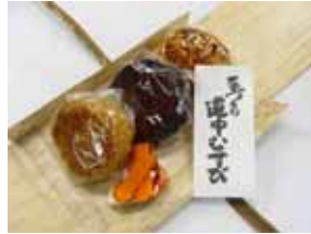
復刻道中むすび(郡山駅)