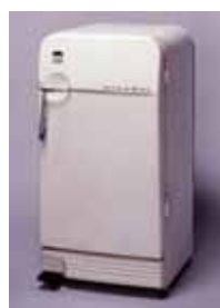
電気冷蔵庫(実物) 1958年 日立製 川崎市市民ミュージアム所蔵