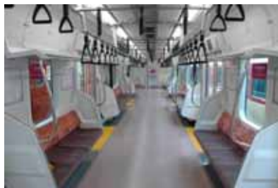
E233系電車車内(イメージ)