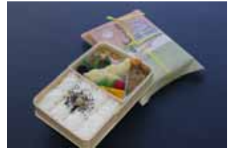
復刻お楽しみ弁当(小田原駅)