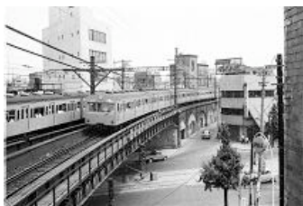
101系電車 1957(昭和32)年登場

205系電車とE233系電車はモックアップ展示を行います。また205系電車は着座体験ができます。