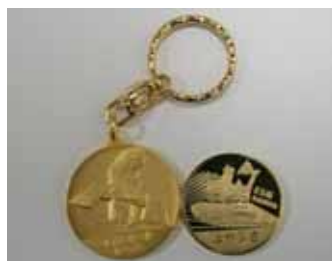
記念メダル、キーホルダー 新幹線はやぶさは3月上旬販売予定

鉄道博物館内の「ミュージアムショップ」で新幹線E5系「はやぶさ」と小惑星探査機「はやぶさ」の関連グッズを販売します。また、青森の美しさや美味しさを下(舌)調べできる青森県の名産品も期間内限定で販売します。