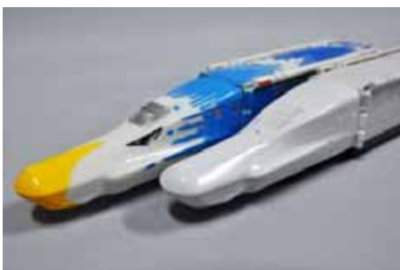
新幹線E5系「はやぶさ」模型(VooV)