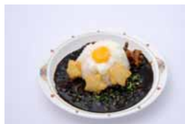
黒のビーフカレー“銀河”