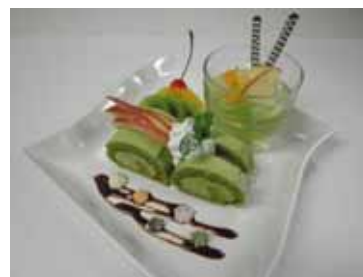
スイーツはやぶさ