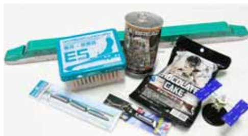
ストラップ、ランチボックス、ロールケーキ 宇宙食、ドライフーズ、模型など