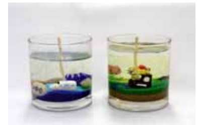
キャンドル <イメージ>