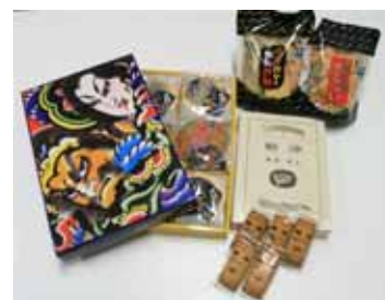
青森県名産品のせんべいやクッキーなど