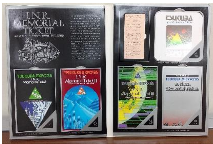
つくば万博記念乗車券セット