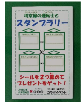
シールラリー台紙(イメージ)