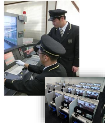
乗務員のお仕事体験(イメージ)

「乗務員の一日」を映像で紹介した後、運転士見習いとして、現役の乗務員が講師の「運転士体験教室」で運転士試験合格を目指します。運転士試験に合格した方には、「オリジナル運転士免許証」を交付します。当日、13:00から南館1F E5系新幹線モックアップ・400系新幹線前イベントスペースにて整理券を配布します。(先着50名、なくなり次第配布終了)