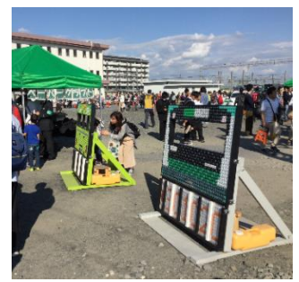
電車キャプアート(イメージ)