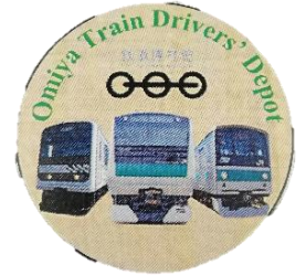
オリジナル缶バッジ(イメージ)