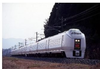
平成元年に登場したJR東日本初の特急車両651系「スーパーひたち」