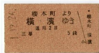
昭和元年12月26日の乗車券 (昭和時代最初期の日付)