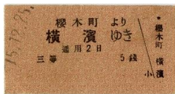
大正15年12月25日の乗車券 (大正時代最後の日付)