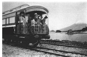
新橋～下関間に設定された特急列車の展望車(明治45年)