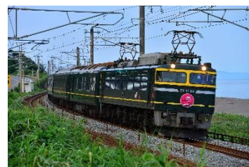
平成元年に登場した豪華寝台特急「トワイライトエクスプレス」