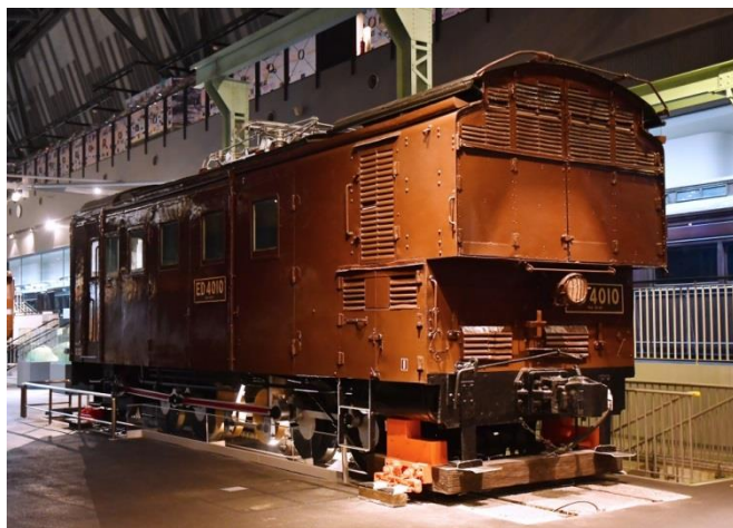
車両ステーションに展示中の ED40形式10号電気機関車