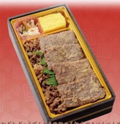
よねざわぎょうてんとしゅうぎょうめいめい御膳 米沢牛 伝統の百年焼肉弁当

創業100年以上を誇る米沢の酒肉、醸造元の熟成味噌。 駅弁製造元の職人の配合・製法で、米沢牛を堪能できる焼き上げました。