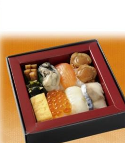
あもりでさくらひのしぐさひやくばーせんぞすしべんどう 青森と三陸の 食材100%寿司弁当