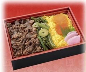
なつめしんしゅうぎょうごはん 夏の信州牛ごはん

▲A4クラスの信州牛の国産肉とわさびを添えたご飯の上に ゆめと鶏卵玉子を彩りよく盛り込んだ高級です。 肉厚の信州牛も絶品の信州牛御膳です。